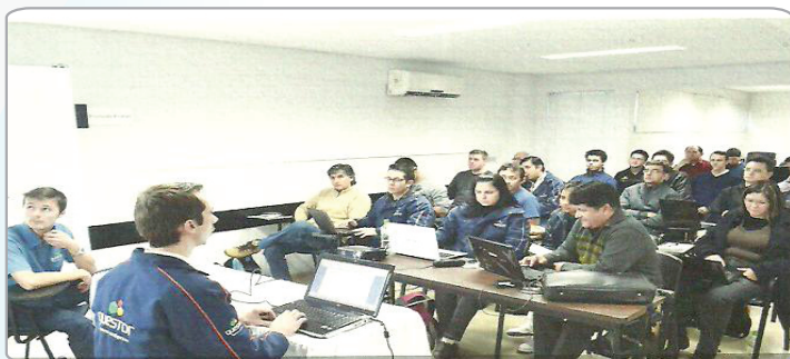
Questor Empresarial Realiza Treinamento com as Revendas Chapecó - SC