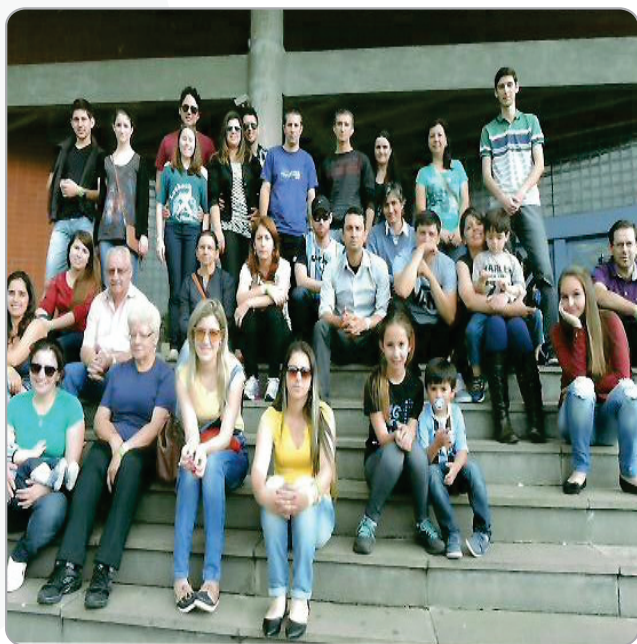
Museu de Tecnologia da PUC

2015: Acesso promove viagem de confraternização de final de ano para Porto Alegre.