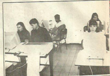
Laboratório da Acesso Informática

A Acesso Informática lança no mercado novos programas para assessoramento de empresas que desejem agilizar suas atividades